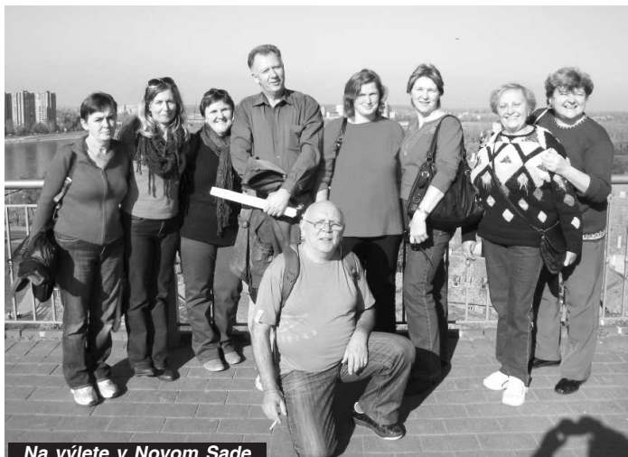
Na výlete v Novom Sade