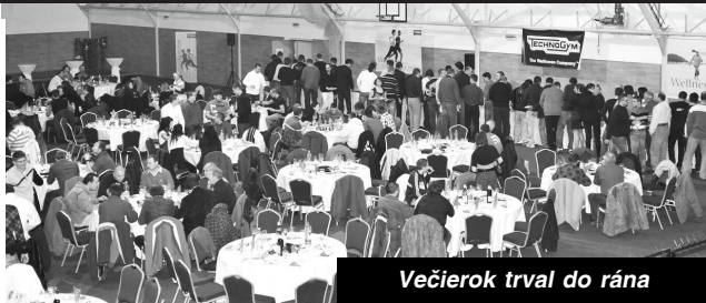
Večierok trval do rána