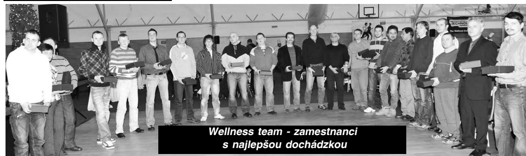
Wellness team - zamestnanci s najlepšou dochádzkou