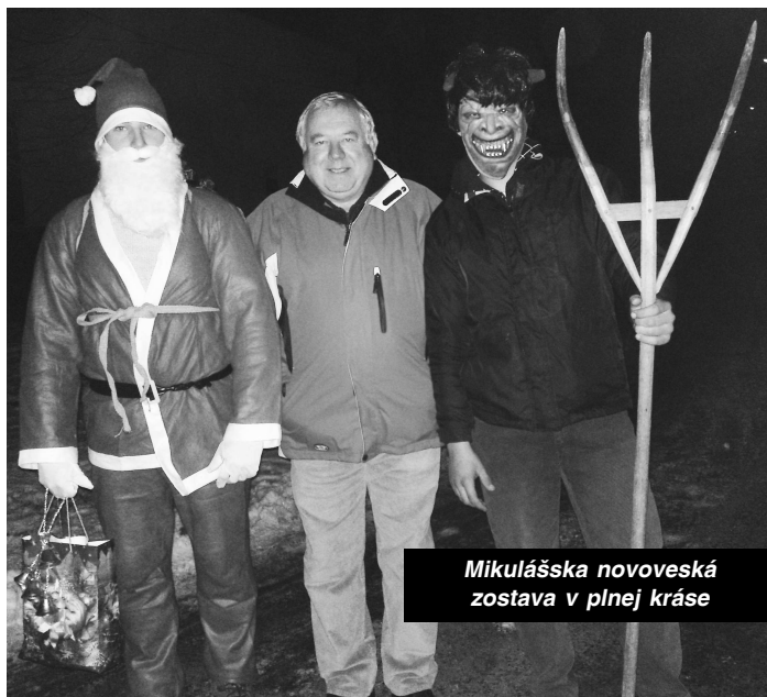
Mikulášska novoveská zostava v plnej kráse