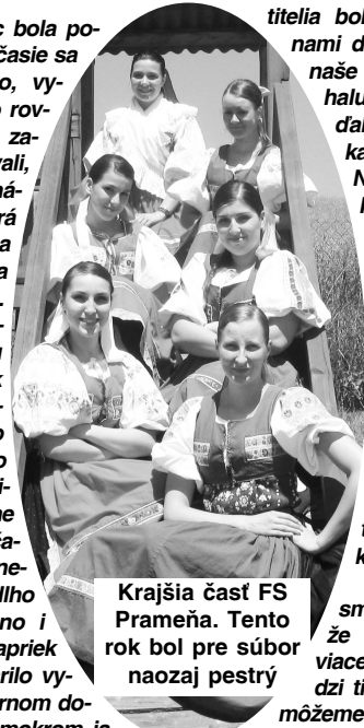
Krajšia časť FS Prameňa. Tento rok bol pre súbor naozaj pestrý

Lehôtky. Malá obec bola po-hostinná, aj keď počasie sa nevydarilo a pršalo, vystúpenie v KD bolo rovnako príjemné. Zo začiatku sme sa obávali, že divákov bude málo, ale spev a dobrá hudba ich predsa len prilákala a sála bola zrazu plná. Družobná obec Veňarec v Maďarsku tradične každý rok organizuje Haluškovy festival. Rovnako tomu bolo aj tento rok - 11.9.2010. Privítali nás skutočne priateľsky, ale počasie im, žiaľbohu, neprialo. Pršalo už dlho pred festivalom, no i počas neho. Aj napriek tomu sa nám podarilo vystúpiť najprv v kultúrnom dome a potom aj na mokrom javisku, kde nás ľudia veľmi milo privítali. Dievčatám sa šmykalo na mokrom javisku a nám ostatným bo-