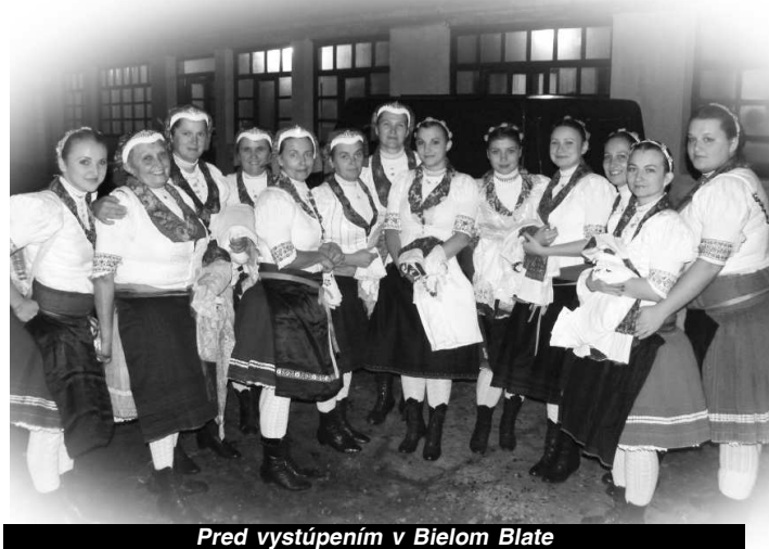
Pred vystúpením v Bielom Blate