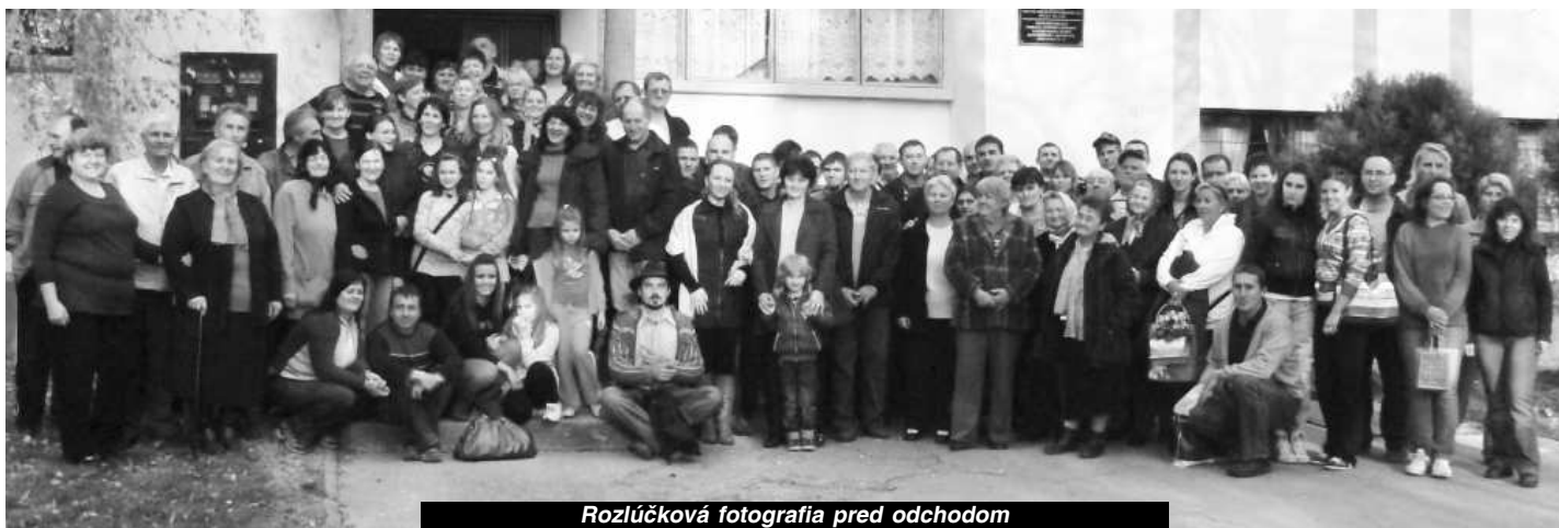
Rozlúčková fotografia pred odchodom