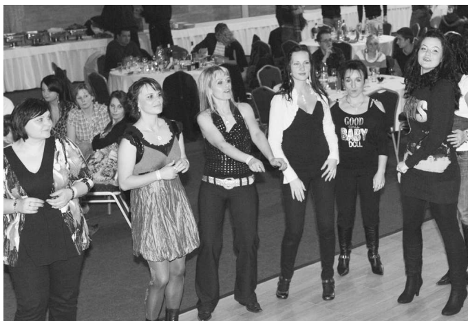
Tanečný parket ovládli takéto šarmatné "technogymácke" dámy