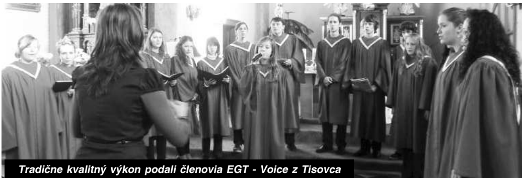
Tradične kvalitný výkon podali členovia EGT - Voice z Tisovca

- B. PAUČOVÁ, metodik pre hudobné žánre. -