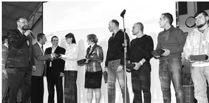
Cenu za "Neustále zlepšovanie sa" si prevzal aj tím lakovne a brúsiarne