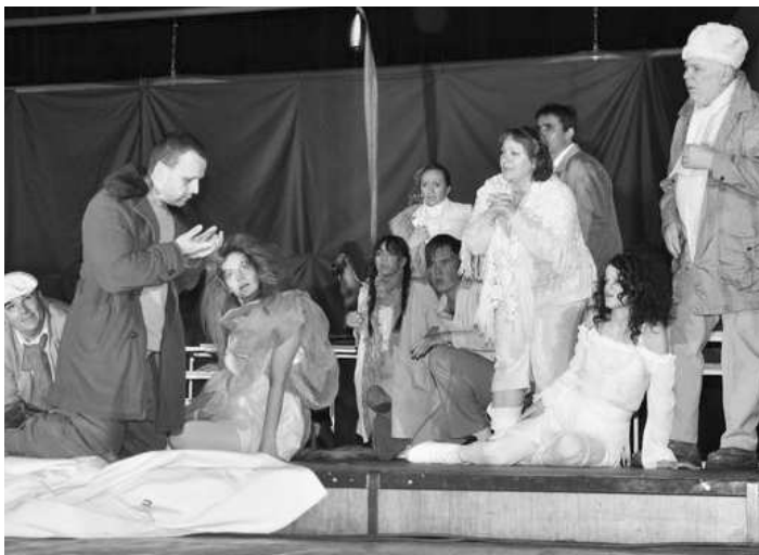
● O dramatické situácie v predstavení nebola núdza

sú moji kamaráti a odrazu som bola v úlohe diktátora. Ale to aj treba, lebo réžia bez diktátu by nebola réžiou.