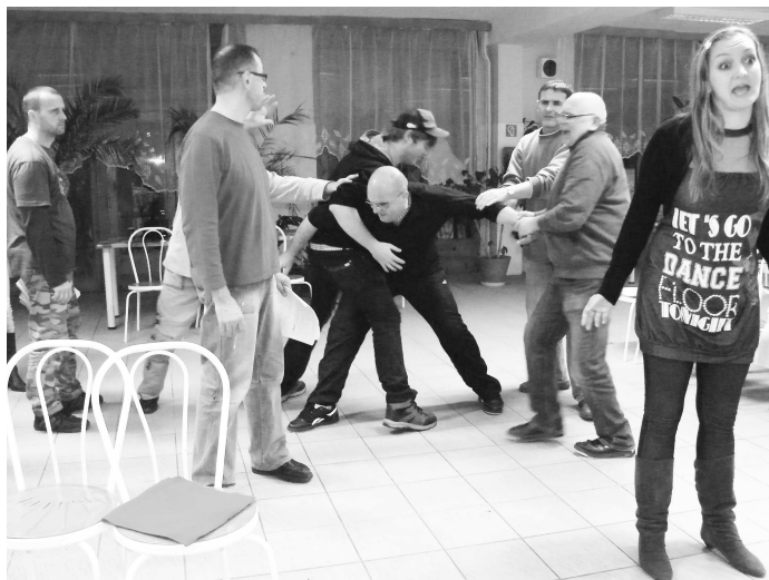
• Počas skúšok bolo horúco

...a s napätím sledovalo dianie na javisku od začiatku až do konca."