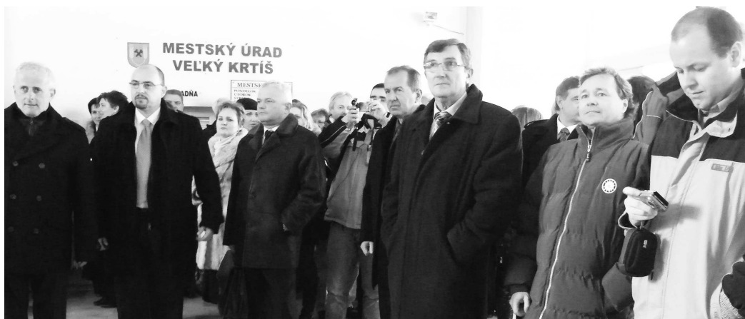
● Odhalienu pamätnej tabule sa s uspokojením prizerali pozvaní hostia