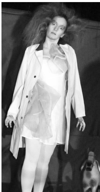
• Vojna v podaní J. Bányayovej

niekedy až morbidne, núti nás však každého práve v tomto predvianočnom období zamyslieť sa nad sebou."