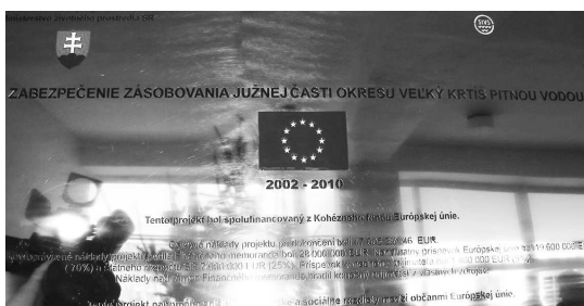
● Pamätná tabuľa bude pripomínať roky výstavby vodovodu