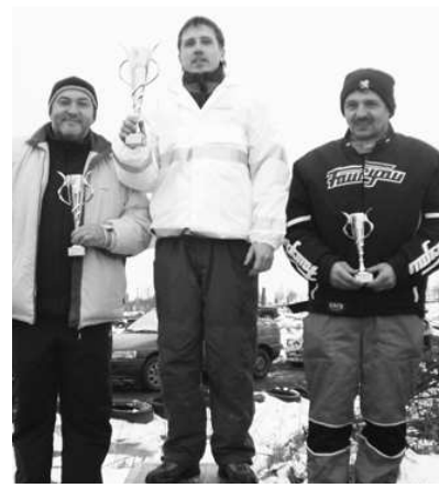
Trojica najlepších na stupňoch víťazov

Novú sezónu HobbyRallyCup odštartovali priaznivci HRC 9.1. 2011 úvodnými Novoročnými pretekmi v Rally Parku vo Veľkých Zlievcach. Dobre pripravená trať a ešte lepšie pripravení pretekári boli zárukou pre rýchle jazdy, ktoré naozaj potešili oko diváka. V prvom kole sa jazdci "naladili" na trať a vyskúšali si, kde sú hranice možnosti na danom povrchu. V ďalších dvoch kolách už dominovala technika, rýchlosť a jazdecké umenie pretekárov. Najbližšie podujatie budú Valentínske preteky 13.2. a 6.3.už štartuje seriál 10 pretekov HRC.