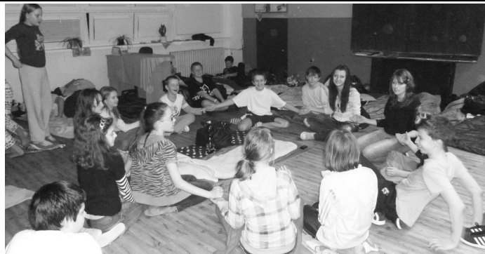
Pre deti bolo podujatie Noc s Andersenom nezabudnuteľným zážitkom plným zábavných aktivít a hier