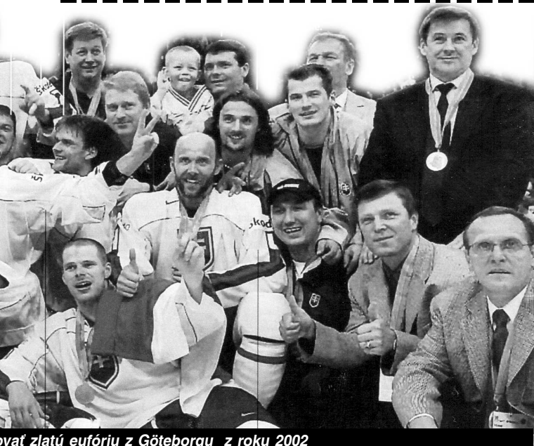
...ovať zlatú eufóriu z Göteborgu z roku 2002

Svoje tipy nám posielajte, alebo prineste do redakcie do piatku 5.5. 2011.