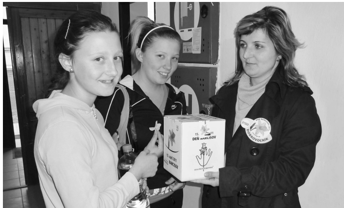
Vyzbierané finančné príspevky v zapečatenej pokladničke odovzdali podľa zmluvy o realizácii zbierky partnerovi LC- ONCOMED, s.r.o, v Lučenci, ktorá spolupracuje s Ligou proti rakovine, pobočka Filákov.