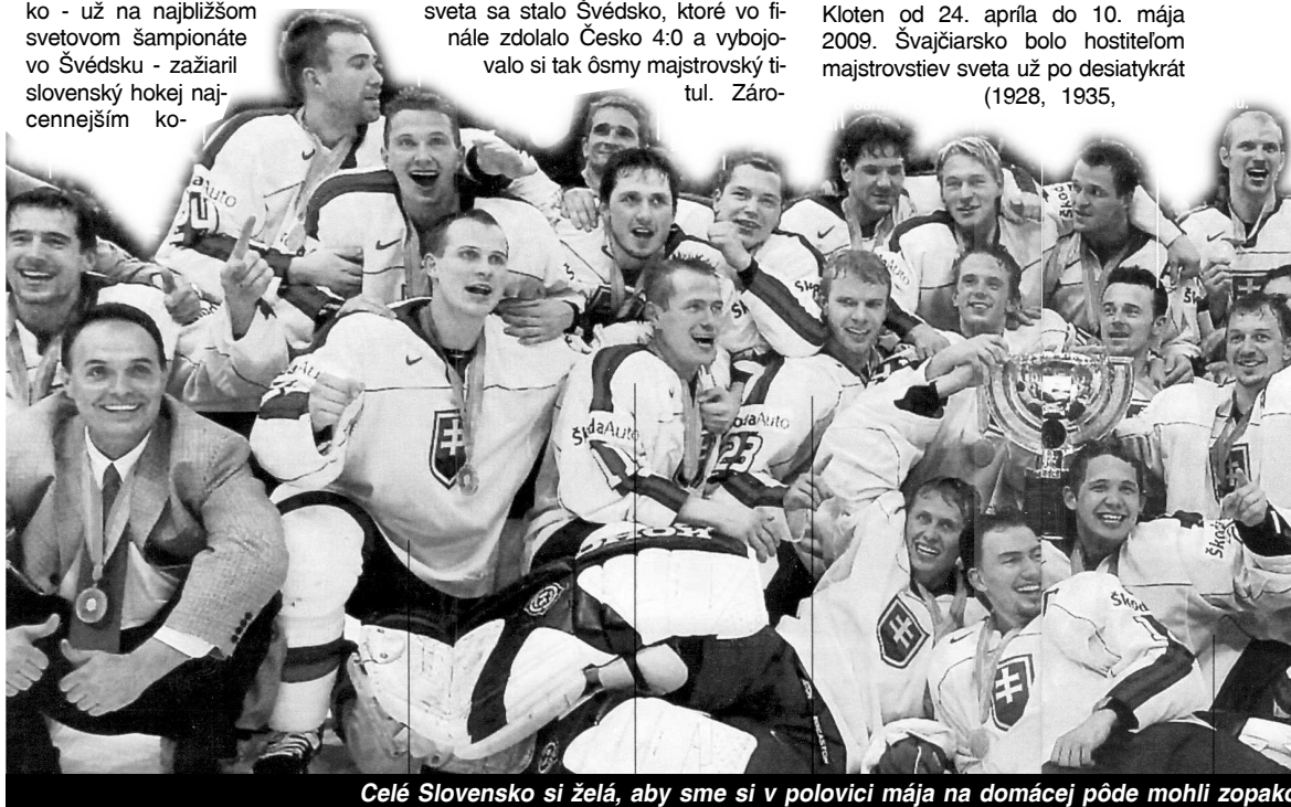
Celé Slovensko si želá, aby sme si v polovici mája na domácej pôde mohli zopakovať

Rok 2009 . Majstrovstvá sveta v ľadovom hokeji 2009 boli 73. ročníkom MS v ľadovom hokeji, ktorý sa konal vo švajčiarskych mestách Bern a Kloten od 24. apríla do 10. mája 2009. Švajčiarsko bolo hosťiteľom majstrovstiev sveta už po desiatykrát (1928, 1935,