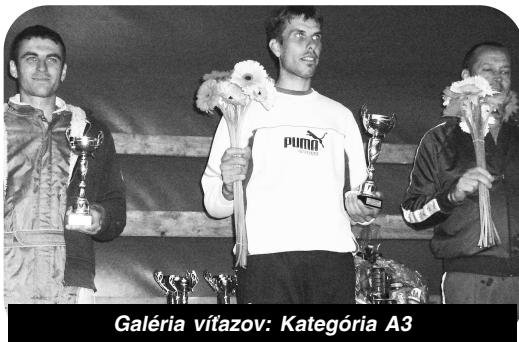
Galéria víťazov: Kategória A3