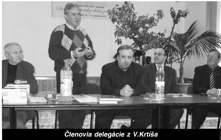
Členovia delegácie z V. Krtíša