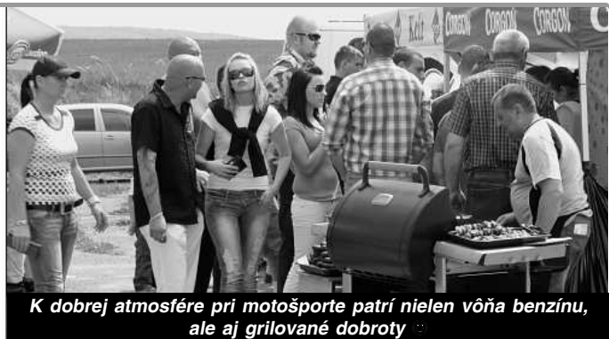
K dobrej atmosfére pri motošporte patrí nielen vôňa benzínu, ale aj grilované dobroty

Posledná aprílová sobota sa niesla na dolnostrehovskom letisku v znamení burácania motorov, piskajúcich gúm a vône spáleného benzínu.