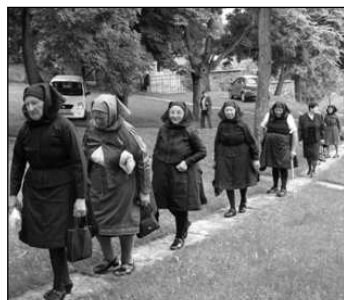
Najstaršie Slovenky cestou do kostola