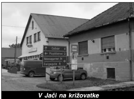
V Jači na križovatke

Na ceste do Asódu leží aj Ďurka (Galgagyörk), predtým aj Slovenská Ďur-