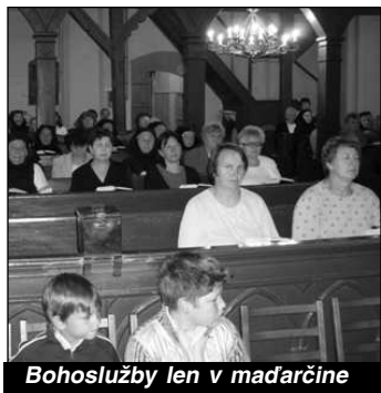
Bohoslužby len v maďarčine