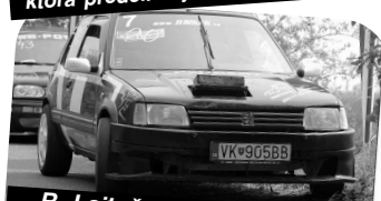
R. Lajtošovi ušlo prvenstvo v kat. A3 o 3,5 sekundy