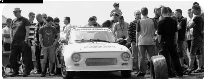
Diváci obdivovali aj takéto parádne upravené "škodovečky"...