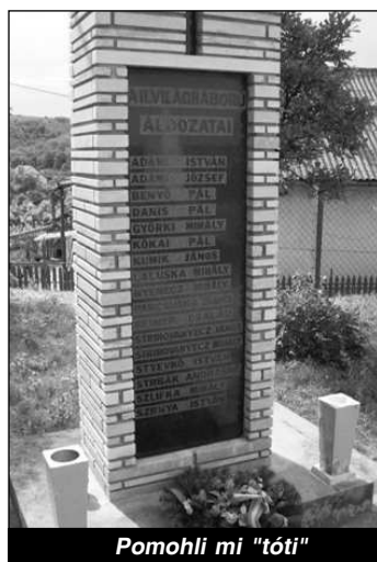
Pomohli mi "tót"