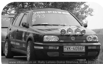
G.Đord a jeho VW VR6