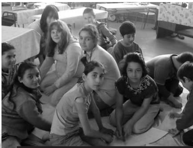
Symbolom priateľstva týchto detí zo ZŠ na Poľnej vo V.Krtíši bola pestrofarebná dúha, ktorú spoločne vyrobili.

Túto otázku si každý z nás už mnohokrát položil a verím, že každý na ňu pozná odpoveď, ktorá môže byť aj takáto: "Priateľ je človek, ktorý vždy stojí pri nás, nezištne pomôže a na ktorého sa môžeme spoľahnúť." V tomto duchu prebiehal na našej ZŠ, Ul. Poľná 1 vo Veľkom Krtíši celý mesiac apríl. Deti vytvorili krásnu dúhu priateľstva, ktorá má ľudí spájať. Má ich viesť k vzájomnej tolerancii a pomoci. Preto starší žiaci pomáhali