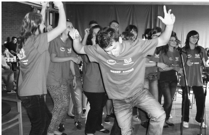
Zábave pri karaoke vôbec nemusíte poznať jazyk, v ktorej sa pieseň spieva - to zistili aj žiaci z M. Kameňa.