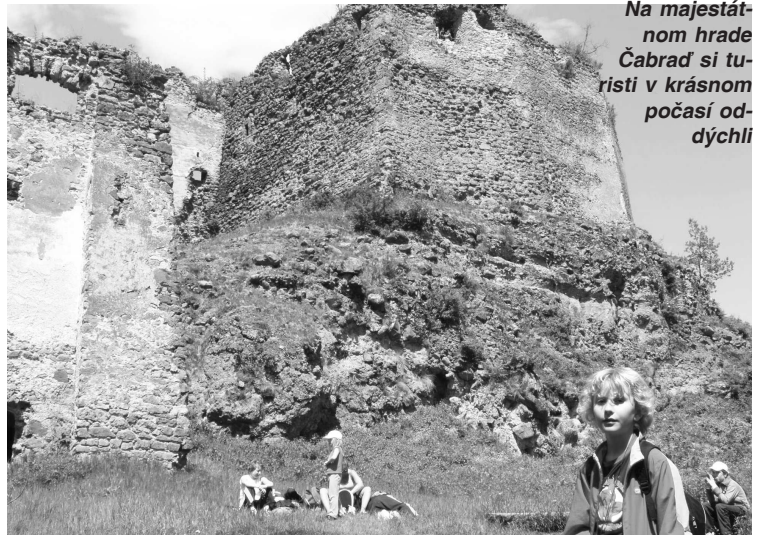
Na majestátom hrade Čabraď si turisti v krásnom počasí oddýchli

Mladí matičiari v Hrušove i tento rok dodržali tradíciu a pekne potme (aby bolo ráno prekvapenie) postavili máj v strede obce i niektorým dievčencom. Keďže v máji si pripomínáme i Deň víťazstva nad fašizmom pripravila Matičica slovenská, Obec Hrušov, Slovenský klub turistov a ďalší spoluorganizátori sériu podujatí pod názvom "S úctou a vďakou". V sobotu 7. 5. sa skupina účastníkov zo širokého okolia vydala na už 30. ročník Pochodu vďaky na hrad Čab-