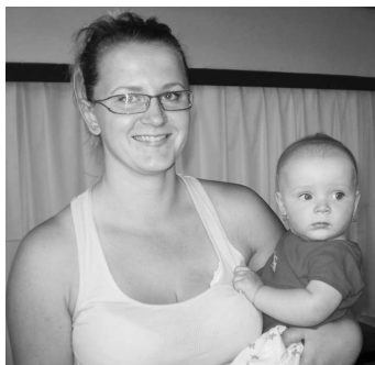
Dobrá vec podporila aj táto mamička, ktorá prišla darovať krv, aj s touto malou, možno raz budúcou daryňou