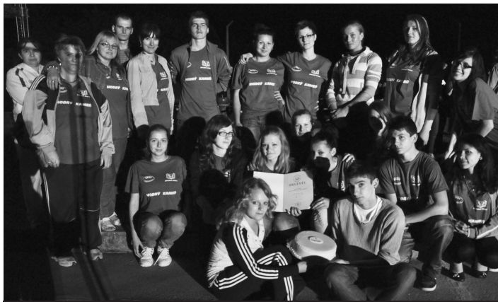
Za víťazstvo v súťaži Hry bez hraníc si slovenskí žiaci z M. Kameňa pochutili na sladkej odmene.

V stredu 8. júna 2011 sa konali v dopoludňajších hodinách súbežne v dvoch miestnostiach Kultúrneho centra Mikszátha Kálmána v Balašských Ďarmotách konferencie - a to Konferencia žiackych rád stredných škôl a Konferencia riaditeľov stredných škôl. Predsedovia jednotlivých žiackych rád predstavili ostatným delegáciám svoju školu a aktivity, ktoré žiacka rada a jej členovia organizujú. Delegácia Spojenej školy v Modrom Kameni predstavila svoju školu a činnosť žiackej rady prostredníctvom pripravenej prezentácie, ktorú komentovala M. Bariaková a do anglického jazyka ju simultánne prekladala D. Štolcová.