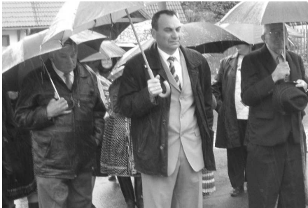
Pochod vďaky začal položením kytice k pamätníku padlých

Mesiac máj patrí medzi obdobia s najkladnejšími prívlastkami. Už prvý deň patrí sviatku práce ale aj tradícii stavania májov, ktorú rôznymi formami realizovali v dedinách i mestách tamojší mládenci. Niekde stavali len svojim vyvoleným dievčencom, inde každej dievke, niekde boli z brezových inde z jedľových, smrekových, hrabových, dubových mladých stromov ozdobených stužkami, niekde i kruhom, alebo dokonca s pripevnenou fľašou na vrchole.