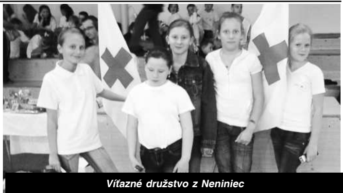
Víťazné družstvo z Neninec