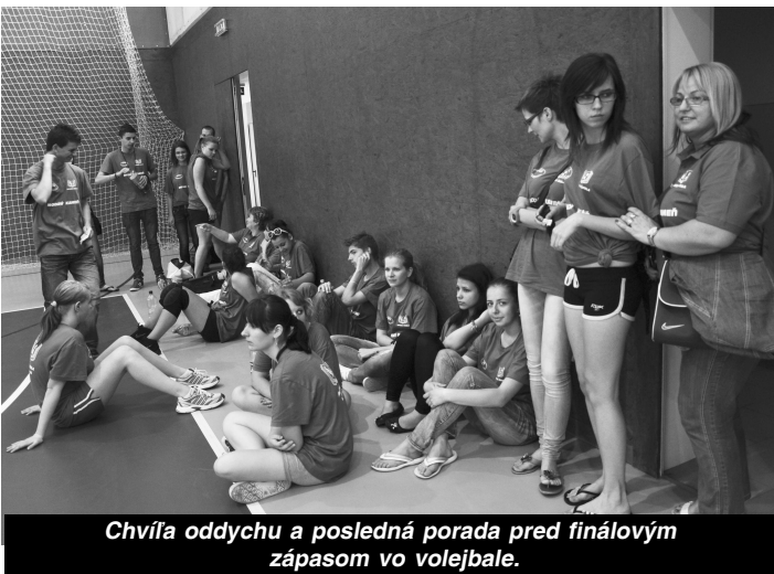
Chvilka oddychu a posledná porada pred finálovým zápasom vo volejbale.