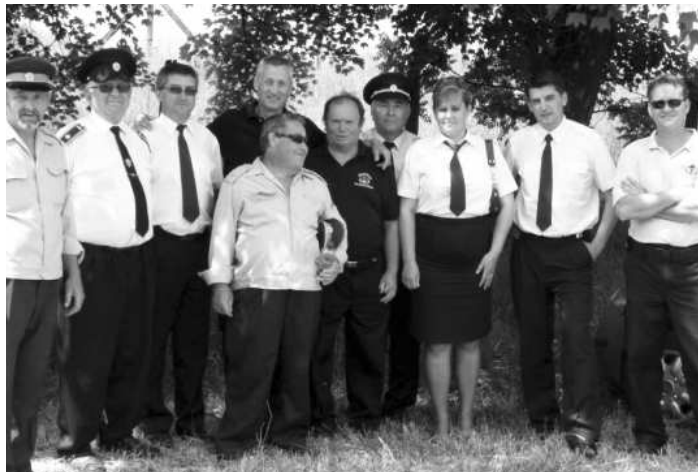
Počasie prišlo stretnutiu hasičov a prispelo ku príjemnej atmosfére

obce. Podujatie tým nadobudne rozmernejší význam a osloví širšiu vrstvu obyvateľstva. Tak to bolo aj v tomto prípade, pretože v malebnej obci slávil "Nižanské dni". Presne tak to bolo napísané i na ústrednom nápise, čo svedčí o fakte, že obyvatelia tejto lokality sú pôvodom Slováci. Aj keď slovenčina znela veľmi zriedka, atmosféra