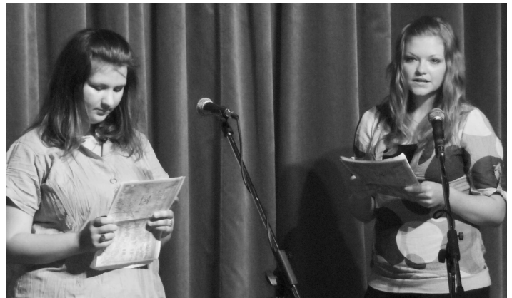
Zástupkyne Žiackej rady zo SŠ v M. Kameni prezentovali svoju činnosť a vízie.