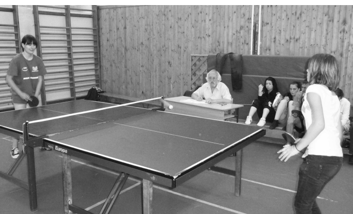
V oblasti športu sa súťažilo aj v stolnom tenise, v ktorom sme obsadili tretie miesto.