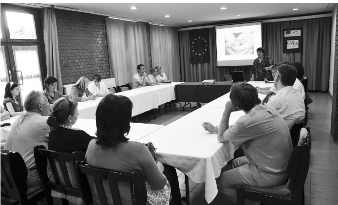
Riaditelia škôl, ktoré sa zúčastnili juniálesu sa stretli na výmene skúseností a poznatkov z vyučovacieho a výchovného procesu.