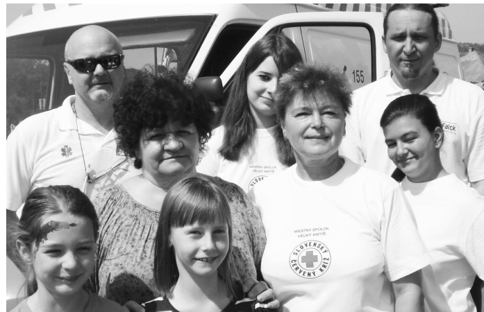
Tento tím pripravil pre škôlkarov simulovanú akciu, určite im jej návštev a zdolanie pomôže, ak sa s podobným prípadom stretnú v realite

Našťastie to bola len simulovaná situácia, ktorou dobrovoľníci Miestneho spolku Slovenského červeného kríža a žiaci zo ZŠ Nám. A. H. Škultétyho z krúžku "Mladý zdravotník" chceli deťom ukázať, aké je zdravie dôležité, že je potrebné pomôcť druhému a nebať sa podať prvú pomoc. Tejto akcie sa zúčastnili škôlkari z MŠ na Poľnej vo Veľkom Krtíši a jej alokované triedy z Ul. Červenej armády, P. O. Hviezdoslava, SNP, Št. Tučeka a jej deti predškolského veku, ktoré sú zapojené v projekte Mládeže Slovenského červeného kríža EDI - Evič-