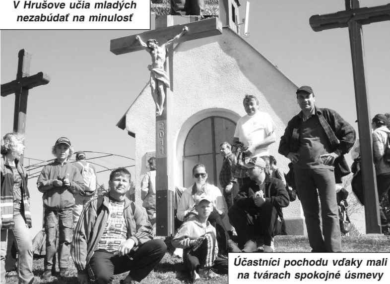
Účastníci pochodu vďaky mali na tvárach spokojné úsmevy

Mladí matičiari v Hrušove i tento rok dodržali tradíciu a pekne potme (aby bolo ráno prekvapenie) postavili máj v strede obce i niektorým dievčencom. Keďže v máji si pripomínáme i Deň víťazstva nad fašizmom pripravila Matičica slovenská, Obec Hrušov, Slovenský klub turistov a ďalší spoluorganizátori sériu podujatí pod názvom "S úctou a vďakou". V sobotu 7. 5. sa skupina účastníkov zo širokého okolia vydala na už 30. ročník Pochodu vďaky na hrad Čab-