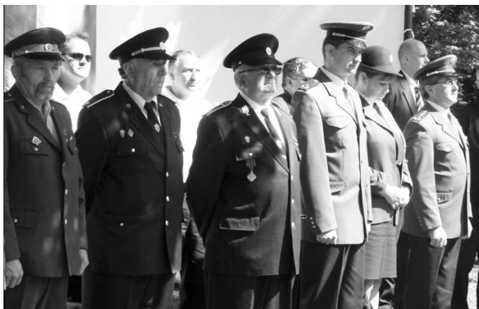
Slávnostný nástup zástupcov hasičov z oboch strán ľpa