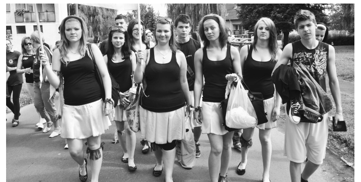
V uliciach Balašských Ďarmôt boli naše dievčatá neprehliadnuteľné a zožali aj potlesk.