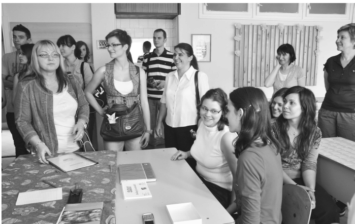
Pri návštevách maďarských stredných škôl obdivovali žiaci klubovne, v ktorých ich vrstovníci trávia veľa voľných chvíľ.