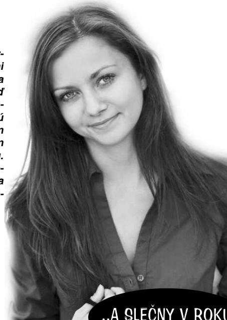
..A SLEČNY V ROKU 2011