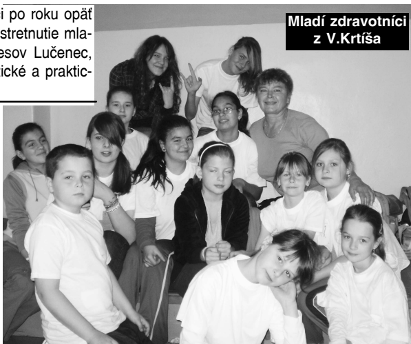
Mladí zdravotníci z V.Krtíša

II. stupeň výsledky: 1. miesto ZŠ Málinec B -166