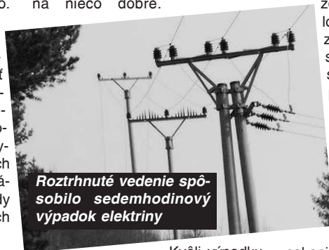
Roztrhnuté vedenie spôsobilo sedemhodinový výpadok elektriny

Opäť sa potvrdilo, že všetko zlé je na niečo dobré.