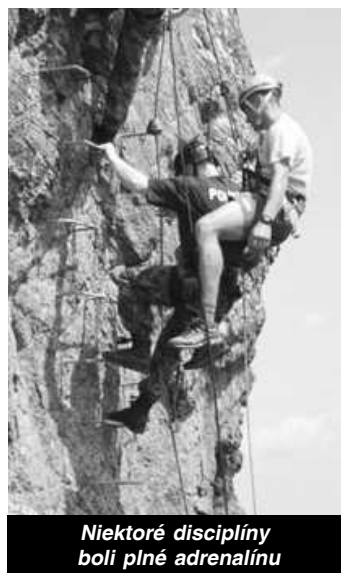
Niektoré disciplíny boli plné adrenalínu

Minuloročné víťazstvo aj tento rok obhájil tím Útvaru osobitného určenia Prezídia Policajného zboru v Bratislave. Víťazný pohár s titulom