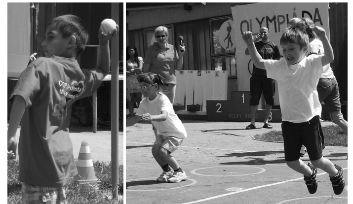
Skok znožmo a hod tenisovou loptičkou deti zvládali vynikajúco