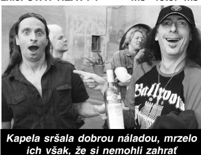
Kapela sršala dobrou náladou, mrzelo ich však, že si nemohli zahrať

Všetci priaznivci metalovej muziky zaregistrovali, že podujatie Modrý Kameň Fest sa na nádvorí hradu nakoniec neuskutočnilo. Organizátor nám poskytol nasledovné vyjadrenie: „Festival sa neuskutočnil kvôli technickým problémom. Nový termín oznámime v najbližších dňoch. Zakúpené lístky ostávajú v platnosti. Skupina Gamma Ray si bola pozrieť modrokamenský hrad a prejavila veľký záujem odohrať svoju show v náhradnom termíne. Ďakujú svojim fanúšikom za podporu a veria, že nádvorie bude nabudúce praskať vo švíkoch! Veľmi si pochvalovali pohostinnosť i ubytovanie. Ich odkaz znie: STAY HEAVY !“ -ms