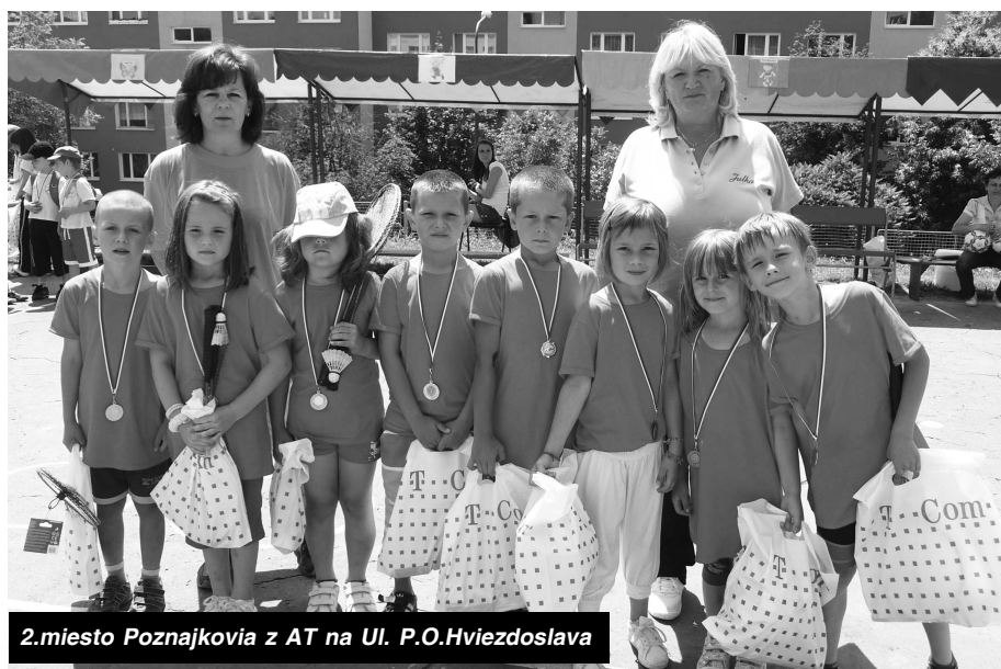
2.miesto Poznajkovia z AT na Ul. P.O.Hviezdoslava