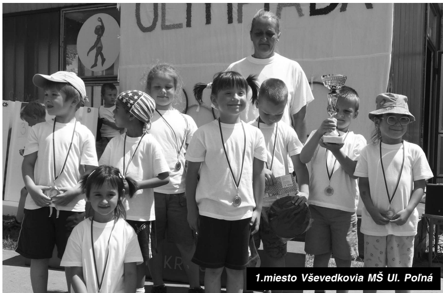
1.miesto Vševedkovia MŠ Ul. Poľná