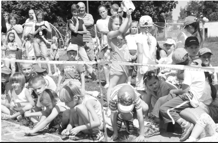
Malých športovcov prišli podporiť ich kamaráti a rodičia