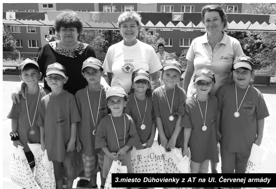
3.miesto Dúhovienvy z AT na Ul. Červenej armády