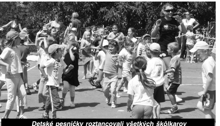
Detské pesničky roztancovali všetkých škôlkarov