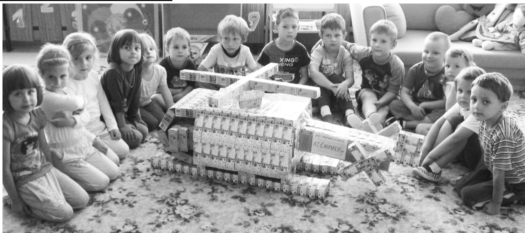
Prvé miesto za vrtuľník získali deti z alokovaných tried na Ul. Červenej armády.

Ešte pred vyhodnotením súťaže, si každý mohol pozrieť, čo všetko