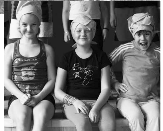
Deti sa vyšantili dosýtosť. Zašportovali si, zaskákali na baloch zo slamy a previezli sa na kónskom záprahu z čias prastarých rodičov