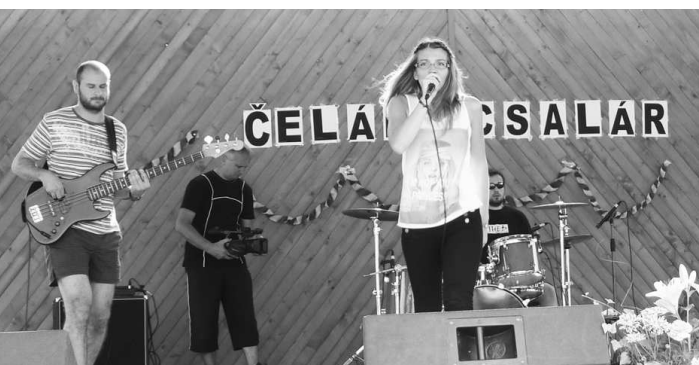
O dobrú zábavu sa postarali súbory Szivárvány, Kiss Palóc, Urpín, skupina The Shed a ďalší...

Talianmi, či Rumunmi. Máme veľmi dobré kontakty s obcami Szécsény, Patvarc a hlavne s Ludányhalászi, je to naša družobná obec,"