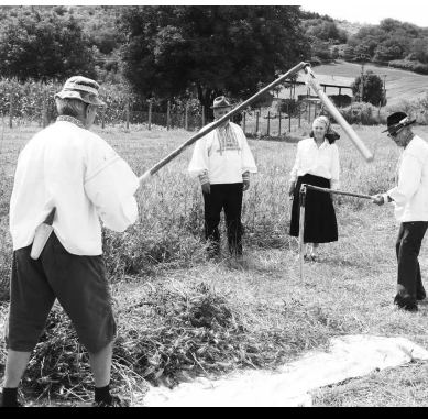
Takto sa kedysi mlátilo obilie cepmi