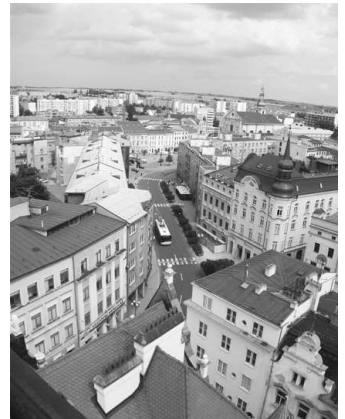
Pohľad z Hlásky na mesto