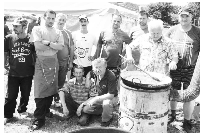
Dobrý guláš, kapustnicu či halászlé je kumšt uvariť