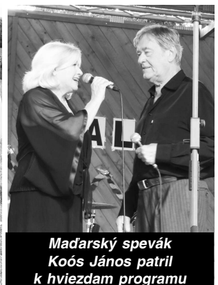
Maďarský spevák Koós János patrí k hviezdám programu