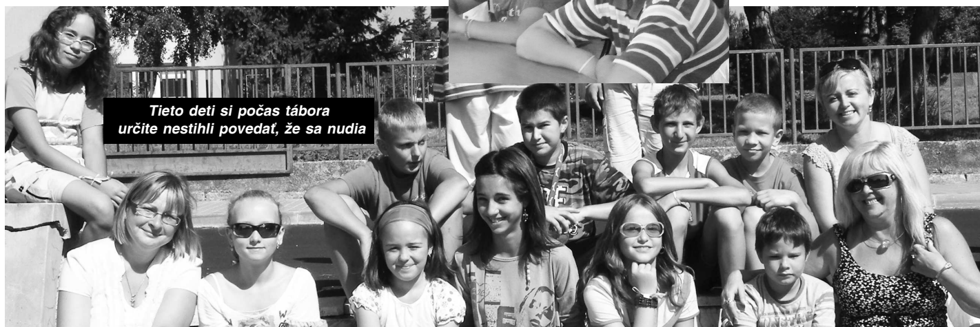
Tieto deti si počas tábora určite nestihli povedať, že sa nudia