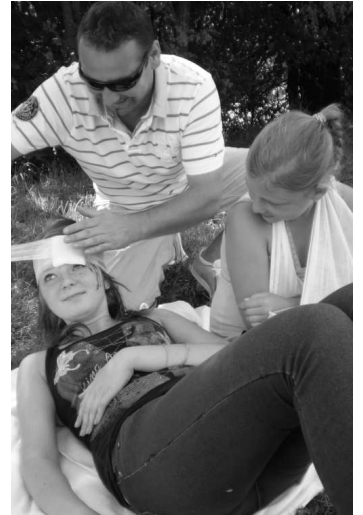
Tento vodič by vám život na ceste určite zachránil