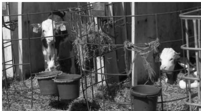
Až tieto teliatka dorastú, budú už ustajnené v novom kravíne

dojí asi za 7 minút. Priemerná dojivosť je 14,5 - 15 litrov na kravu. Celkovo máme 390 dojníc a denne dodávame do mliekarene 5 560 litrov kravského mlieka."