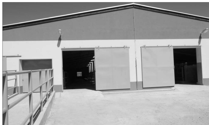
Pri rekonštrukcii kravína dbali aj na pohodlie ustajnených dojníc