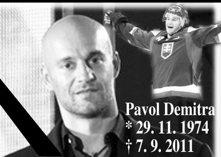
Pavol Demitra * 29. 11. 1974 † 7. 9. 2011

Na tomto mieste mal byť celkom iný úvodník venovaný pozitívnemu mysleniu, pretože zajtra je Svetový deň pozitívneho myslenia. Osud však zamiešal karty po svojom a miesto vymenúvania malicherností na tomto mieste, ktoré nám občas bránia pozitívne myslieť, zasiahla nielen slovenských hokejových fanúšikov, ale celé Slovensko šokujúca správa.