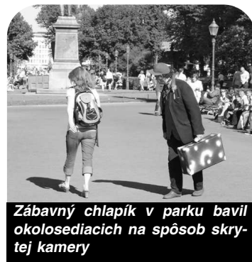
Zábavný chlapík v parku bavil okolosediacich na spôsob skrytej kamery