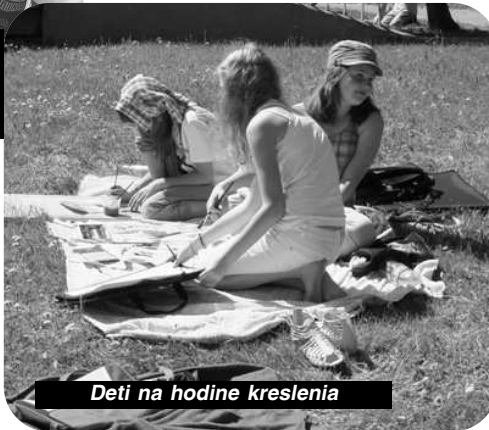
Deti na hodine kreslenia

Nastal čas návratu do centra mesta. Cestou sme obdivovali množstvo oddychujúcich či športujúcich ľudí. Nielen vo Fínsku, ale počas celej našej cesty boli masy ľudí v pohybe, športovali všetci, na chodníkoch pre cyklistov panoval čulý ruch, pritom všetky športoviská boli v prírode a slúžili všetkým. Žiadni policajti nestriehli pri trávnikoch na chodcov, ktorí vstúpili na zelenú plochu, aby im "uložili" pokutu. Ľudia na trávnikoch oddychovali, tancovali, opalovali sa alebo len tak polihovali. Takto sme sa dostali až k známej hokejovej hale Finlandia. Tá je v súčasnosti v rekonštrukcii, lebo nasledujúci rok aj v nej budú prebiehať Majstrovstvá sveta v hokeji. Po krátkej obhliadke okolia haly sme sa konečne dostali do centra, ale mali sme ešte takmer 6 hodín čas do odchodu trajektu. Sadli sme si do parku, v ktorom oddychovali na trávnikoch najmä mladí ľudia. Po chvíli sa v strede parku zjavil rozšafný chlapík, ktorý si začal robiť žarty z okolojdúcich, niečo na spôsob skrytej kamery. Asi po polhodinovej produkcii vybral do klobúka svoju odmenu a namiesto neho nastúpila skupina hudobníkov z Gabunu, okolo ktorej sa čulo zvrhala partia zvukárov, zrejme rozhlasáci. Po nej-akom čase sme sa presunuli bližšie k prístavu, kde mala vystúpenie rocková skupina Caroline a po nej nastúpila iná, tenoraz heavymetalová skupina. Čas sa naplnil a po