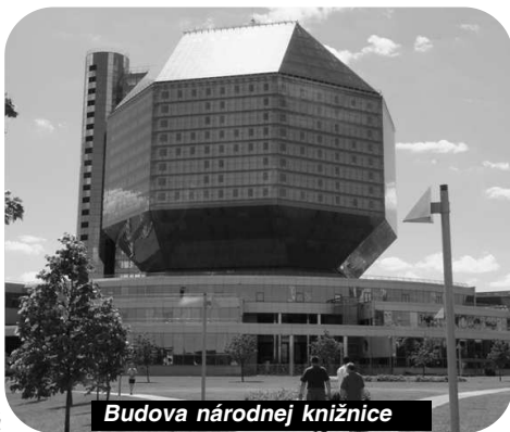
Budova národnej knižnice