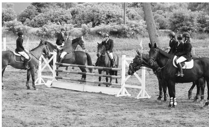
Pred samotnými jazdami si jazdci i kone parkúr pozorne naštudujú.

stupňa ZM skončili na 7. mieste, keď ich neposlúchali koníky a odmietli skočiť cez prekážku, za čo boli jazdci diskvalifikovaní. Sympatická rusovláska trénuje v tomto roku v Závade a s kobyľkou BETINOU sa na pretekoch objavuje iba prvý rok, ale ešte sa jej nestalo, aby odmietla poslušnosť. Veď na pretekoch v Závade skončili iba horším časom na 4. mieste. V. Michalíková: "Nebola som veľmi v pohode, keď som šla na parkúr a tam sa to aj odzrkad-