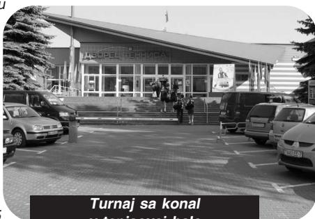
Turnaj sa konal v tenisovej hale

priek všetkým pomôckam, ktoré sme mali k dispozícii, záhadou, a tak asi po hodine blúdenia po všelijakých bulvároch a prospektoch sme sa zjednali s jedným taxikárom, že nás za 5000 rubľov, teda asi za pol eura, zavedie pred náš hotel. Samozrejme, bez do-