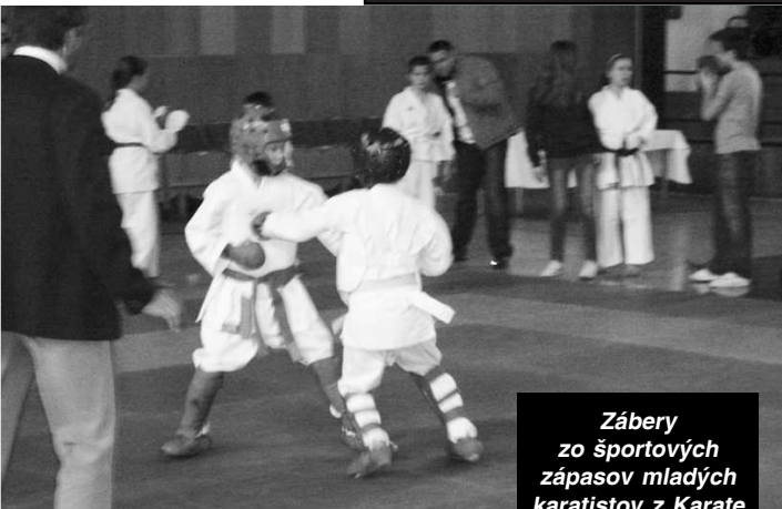
Zábery zo športových zápasov mladých karatistov z Karate klubu V.Krtíš

Mestská športová hala Veľký Krtíš 24. september o 10.00 hod.