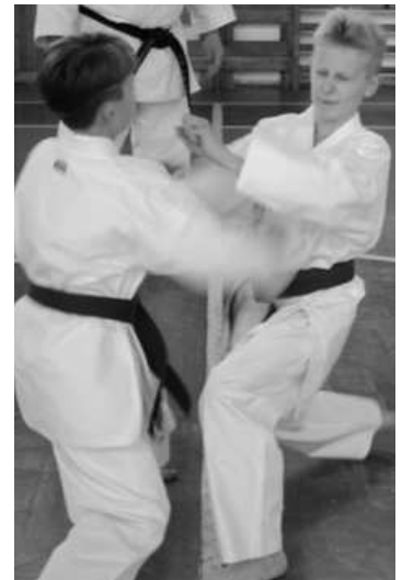
Veľkokrtíšska športová hala bude už o pár dní hostiť okolo 200 - 250 súťažiacich z celého Slovenska. (Ilustračná fotografia cvičencov Karate klubu V.Krtíš)

10.00 - 10.15 - otvorenie a začiatok súťaže, 10.15 - 12.00 - eliminácie + finále kata a kobudo, 12.00 - 13.00 - prestávka, odovzdávanie cien, 13.00 - 15.00 - eliminácie + finále kumite, 15.00 - 15.30 - odovzdávanie cien.