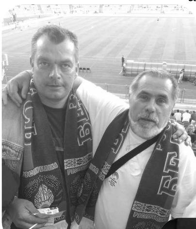
Mojí kolegovia podľahli atmosfére futbalovej kvalifikácie na ME 2012 medzi Bieloruskom a Franciou

ma veľmi zaujala. Okrem toho, že vlastným rozsiahlu zbierku euromincí, slúbil som jednému svojmu známemu, že mu prinesiem jedno a dvojcentovú mincu vydanú vo Fínsku, ktoré mu chýbali do zbierky. Ja som si vybral a doplnil niektoré chýbajúce mince, ale získať malé mince bolo síce jednoduché, ale veľmi drahé. Fin-