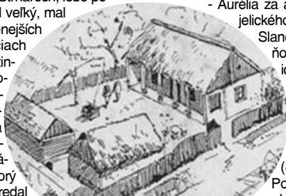
Alberti faluház - dedinský dom ako múzeum