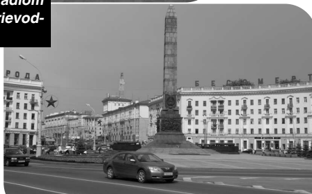
Námestie víťazstva, jedno z najvýznamnejších miest v Minsku