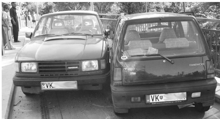
Na dolnoplachtinskom moste niet miesta pre dve autá - už je to definitívne potvrdené...

Na (nekonečne, ako sa zdá často prechádzajúcim) rekonštruovanom dolnoplachtinskom moste sa vo štvrtok 15.9.2011 predpoludním stala kuriózna dopravná nehoda.