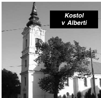
Kostol v Alberti