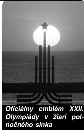
Oficiálny emblém XXII. Olympiády v žiari polnočného slnka