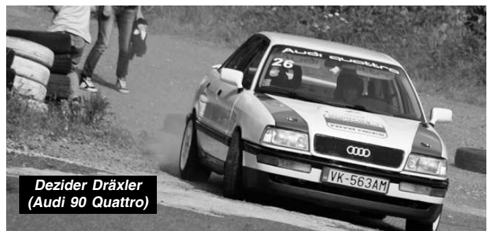
Dezider Dräxler (Audi 90 Quattro)