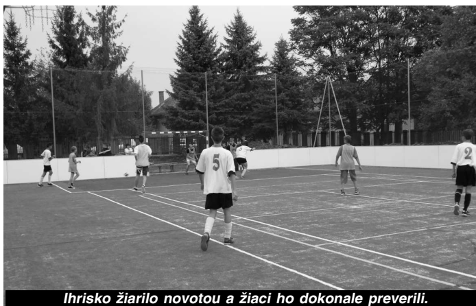
Ihrisko žiarilo novotou a žiaci ho dokonale preverili.