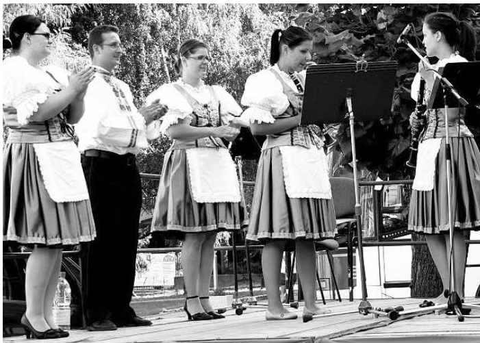
Domáci ocenili aj vystúpenie Hodrušanky