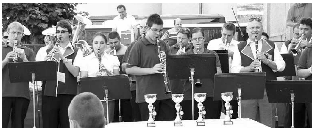
Defilé súborov ukončil monster koncert, vďaka ktorému sa rozliehali tóny dychovky do širokého okolia

Podujatie finančne podporilo Ministerstvo kultúry Slovenskej republiky. Sponzormi podujatia boli Zael Veľký Krtíš, PRP Veľký Krtíš a MIVIS Modrý Kameň. Mediálny partner: Redakcia POKROK