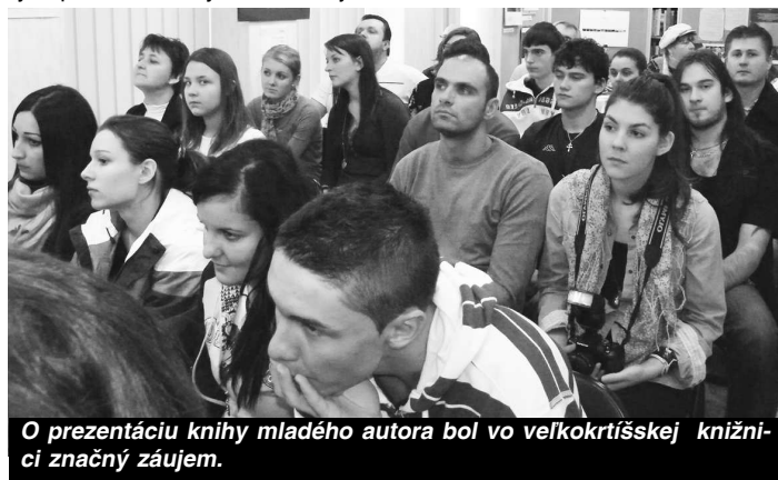
O prezentáciu knihy mladého autora bol vo veľkokrtíšskej knižnici značný záujem.