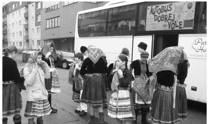
Autobus dobrej vôle na svojej šiestnástej výprave za ľuďmi, ktorí potrebujú pomoc a láskavé slovo