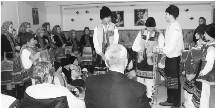
Hrušovčania potešili seniorov v Domovoch dôchodcov v Santovke i Dubnici a tradične aj deti v Detskom domove v Novej Bani