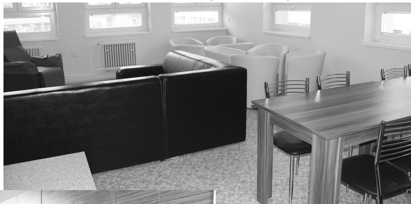
Kuchyňa i spoločenská miestnosť DSS Radosť sú zariadené novým moderným nábytkom

V prvom polroku chceme, aj na žiadosť zdravotných poisťovní, spojiť OAIM s internou JIS-kou a s chirurgickou JIS-kou do jedného komplexu, do tzn. centrálny resp. multifunkčnej JIS-ky resp. dá sa povedať aj do jedného oddelenia intenzívnej medicíny. V nemocniciach s porovnateľnou veľkosťou (Pokračovanie na str.5)