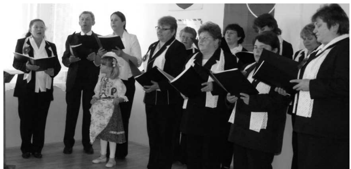
Zasadnutie MAS spestrili svojim vystúpením členky speváckeho zboru z Čeloviec i inštrumentalista z Balogu nad Ipľom.