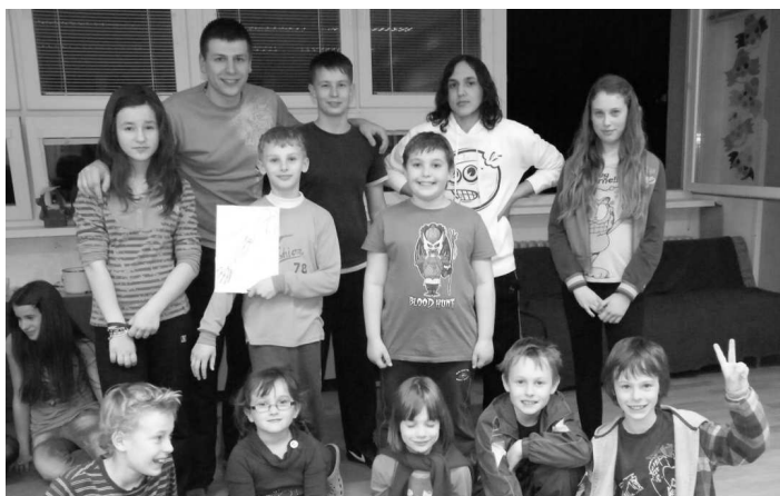
V herni Mgr. P. Bobála si deti zajazdili na dostihoch, alebo si zahrali na elektrické vedenie.