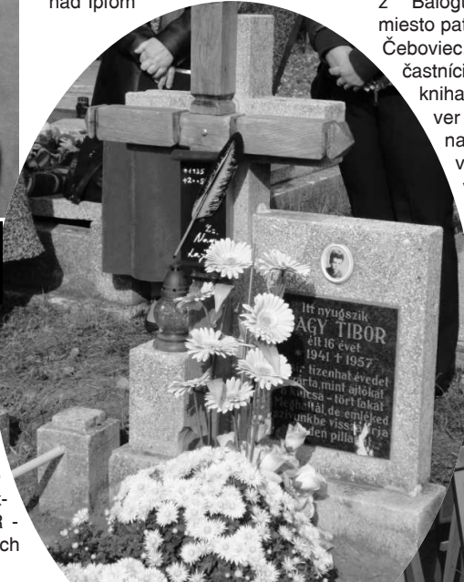
Program začal na miestnom cintoríne spomienkou pri hrobe spisovateľa