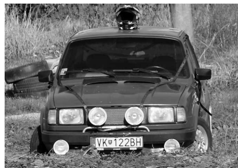
Odstavená škodovka - spomienka na Miťa Petrova