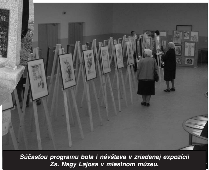
Súčasťou programu bola i návšteva v zriadenej expozícii Zs. Nagy Lajosa v miestnom múzeu.