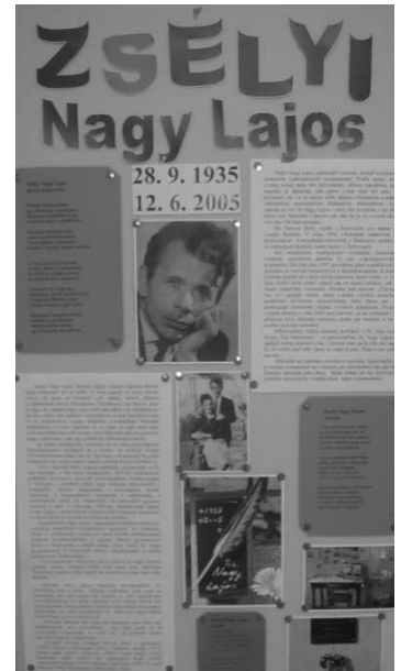
O živote a dielach spisovateľa sa návštevníci dozvedeli z tejto informačnej tabule