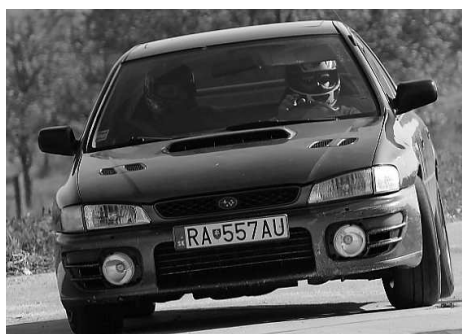
Jozef Poprocký na Subaru Impreza skončil v kategórii A5 na 2. mieste