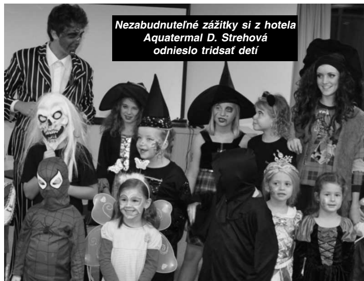
Nezabudnuteľné zážitky si z hotela Aquatermal D. Strehová odnieslo tridsať detí