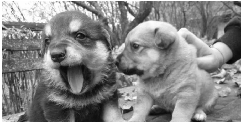
Opustené šteniatka, ktoré OZ Otvorme srdcia - Záchrana psov VK ponúkali pred Vianocami.. V čase našej uzávierky boli stále bez nového domova...

O Lokyho zmiznutí nás informovali jeho majitelia, a keďže my sme vedeli, o akú firmu sa jedná, vedeli sme im poradiť. Najprv si majitelia Lokyho mysleli, že ho nájdú v niektorom z útulkov, ako by to malo po správnosti byť, ak by sa jednalo o legálnu odchyťovú službu. Po službe a jej pracovníkoch sa však zľahla zem, ako sa to stalo