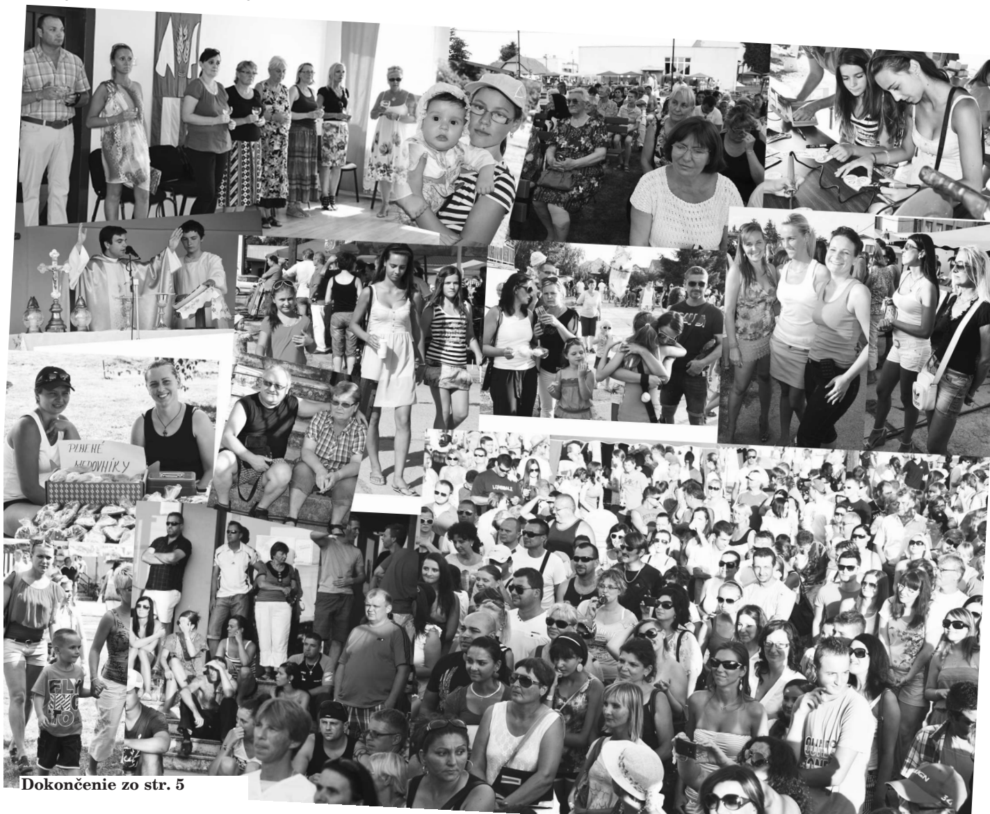
Dokončenie zo str. 5

Keď už chcela kapela skončiť a vyzeralo to, že to myslí vážne, na pódium vyšiel starosta obce a po krátkom dohovore s Kuly sa muzikanti vrátili späť k svojim nástrojom a mikrofónom. Tento čin, ktorý divákov potešil, Kuly zhodnotil s humorom jemu vlastným: " Už sme chceli skončiť, ale starosta nás vrátil späť, lebo povedal, že to nie je len tak, že sme pojedli klobásky, tak si to máme pekne aj odohrať..."