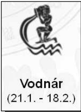
Vodnár (21.1. - 18.2.)

Veľa vecí beriete až príliš vážne, no a to dokonca aj seba. Stále budete mať v predstave, ako je všetko zlé, ako sa vám nedarí a akú smolu máte. Blízkosť neúspechu, ako aj to, že ho cítite vo vzduchu, neznamená,