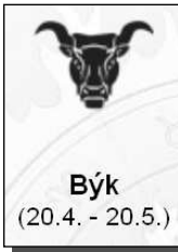
Býk (20.4. - 20.5.)

Menšia dominantnosť, ktorá sa vo vás zobúďza, nikomu neuškodí. Preto je úplne v poriadku, keď ju pustíte von a tým sa zároveň vyhnete akémusi sebatrýzneniu. Okrem toho by ste mali viac počúvať, dostáva sa k vám veľmi veľa cenných rád, ktoré by nemali zostať nevy počuté a nepovšimnuté. Veľmi vám pomôžu svojím prístupom hlavne staršie, vyzretejšie osoby, ktoré vedia, o čom život je. Očakávajte pestrejší spoločenský život, ktorý vás vtiahne do víru skvelej zábavy, kde sa uvoľníte a vypnete.