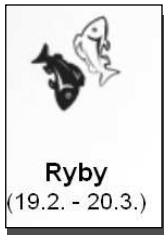
Ryby (19.2. - 20.3.)

Podporenú máte všeobecne aj komunikatívnu, čo sa postará aj o skvelé výsledky v práci. Len si dávajte pozor, aby ste neskĺzli do papuľnatosti a odvrávania tam, kde si to „nemôžete dovoliť“. Osamelé „ryby“ by sa mali sústreďiť na vzdelávanie, láska si vás nájde sama.