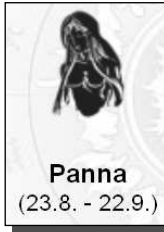
Panna (23.8. - 22.9.)

Vás, ako živel, nezaštaví nikto a nič. Je vaša sezóna, ktorú si vychutnáte naplno. Už s príchodom snežných dní ste vyťahli túlavé topánky, ktoré na cestách, či výletoch deriete ostošesť. Týždeň vám prinesie príjemné chvíle, cestovanie, zábavu – jednoducho úplný relax a bezstarostnú pohodu. Z tej vás však vytrhne jedna záležitosť (úradu – papierovanie), ktorú si musíte vybaviť a to neodkladne. Potom môžete znovu nabehnúť na cestu, z ktorej vás táto povinnosť vykoľajila. Zdravie – prečistenie tela.