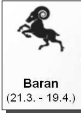
Baran (21.3. - 19.4.)

Hľadíte až príliš ďaleko dopredu. Je to síce fajn mať predstavu o budúcnosti, ale vám začína utekať a unikať realita, ktorá prebieha tu a teraz. Vízie o tom, ako by to všetko malo byť, radšej preneste do