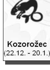
Kozorožec (22.12. - 20.1.)

Potichu sa k vám plazia negatívnejšie pocity – strach, obavy a v prvom rade bezmocnosť pohnúť so záležitosťami. Ste skvelí teoretici, ktorí majú radi všetko premyslené, ale pri premietnutí do skutočnosti vám vždy konečný výsledok skreslí vaša výbušnosť, nervozita a unáhlenosť. Pokúste sa popracovať na trpezlivosti, ktorá všetko „vypiluje“ k tomu, že sa vám to podarí podľa vašich predstáv. Chcelo by to z vašej strany aj viac prejavov lásky, vďaky, nehý, pocitov k najbližším a milovaným. Je na mieste, aby ste mali radi aj sami seba...