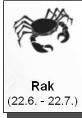
Rak (22.6. - 22.7.)

Pokoj šíriaci sa okolo vás využite na dokončenie rozrobených prác (ženských aj mužských) v domácnostiach a záhradách. Budete sa venovať zveľadovaniu okolia a miesta, v ktorom žijete a tým viac prispejete k svojej pohode. Naskočili ste a nabehli na určité životné tempo, ktoré sa vám začína páčiť a vychutnávať si všetko, čo do dní prichádza. Usídlil sa vo vás pokoj a harmónia, ktoré sú pre túto dobu vzácne. Týždeň v znamení zveľadovania a dotvárania.