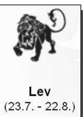
Lev (23.7. - 22.8.)

V prípade núdze alebo urgentnosti sa spoľahnite na svojich priateľov a známych, ktorí vám vždy ochotne a nezištne pomohli. Inak tomu nebude ani po tieto dni, budete viac vyhľadávať blízkosť ľudí, ktorí vás chápu a vedia, kým v skutočnosti ste. Máte plné zuby upätosti a sebakontroly, preto zatúžite po ventile, ktorý si môžete v pokoji aj dopriať. Buďte sami sebou, počas tohto týždňa si to môžete dovoliť. Vyhnite sa oblúkom akýmkoľvek veľkým zmenám. Zdravie – túto oblasť vystihne slovo stabilné.