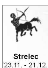
Strelec (23.11. - 21.12.)

Všetko je u vás v poriadku. Čo sa malo doriešiť, sa dokončieva a vy sa budete cítiť lahučká ako pierko. Dokonca aj konflikt medzi vami a známym sa urovná. Celkovo neočakávajte žiadne extrémny na žiadnom poli. Plynulý priebeh dní vám prinesie rodinnú pohodu. Vytvorí sa vám viac voľného času, ktorý je dobrý venovať hlavne rodine, deťom a potom priateľom. Nenútenosť je presne to, čo by ste mali vpustiť do svojho života, vďaka čomu si ho budete viac vychutnávať.