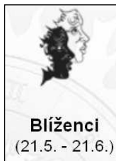
Blíženci (21.5. - 21.6.)

Ste ako loď na mori, ktorá sa hojdá striedavo na menších a väčších vlnách vytváraných vonkajším okolím. Máte tendenciu bojovať, ale pre tentokrát je lepšie splynúť s rytmom vln a naladiť sa na ich pravidelnosť, čím sa vám podarí dokonalé zladenie a vyhnete sa problémom. V prípade, že budete bojovať, budete viac viditeľnejšími a o to skôr narazíte na skaly alebo si vás okolie podmaní natoľko, že pôjdete ku dnu alebo utrpíte karambol. Jednoducho povedané, prijímajte dianie a situácie počas dní s pokojom, na kopanie nohami ešte príde čas.