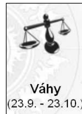
Váhy (23.9. - 23.10.)

Pokojný týždeň prinesie pokojné dni, cez ktoré preplávate, ani nebudete vedieť ako. Zavalení bežnými povinnosťami si ani neuvedomíte, že je koniec týždňa. Menšiu nervozitu pocítite v prepojení na prácu, kde je však vhodnejšie po tieto dni držať jazyk za zubami. Je to záležitosť, ktorá sa behom jedného dňa, dokonca aj hodiny, utrasie a vy sa veľmi rýchlo zaradíte do pracovného kola. Pozor na krádež a stratu. Zdravie – pokožka, koža (znamienka, vyrážky, opary, otlaky a pod.).