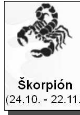
Škorpión (24.10. - 22.11.)

Vy po tieto dni príliš nevystrkujte svoje rožky, nedopadlo by to najlepšie. Ste tak v zapálení pre spravodlivosť a svoju vlastnú pravdu, že ste náchylní veľmi rýchlo spadať do hádok a slovných (niektorí aj do fyzických) potýčok. Veľmi rýchlo vzplaniete a zahoríte, skúste to mať pod kontrolou, ste dostatočne silní, aby ste to ukorigovali. Počas týždňa budete ako zápalka, ktorou nehodno škrtnúť. Tí, o niečo pokojnejší, sa utiahu do svojho vnútorného sveta, prípadne sa budú venovať svojmu duchovnému rastu a analyzovaniu.