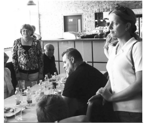
Členovia MO MS spolu s ev. cirkevným zborom si z východu krajiny odniesli krásne spomienky

Po družných debatách, na spoločnom stretnutí predstaviteľov ev. a v. cirkevného zboru a Matice slovenskej vo Vranove, ktorí pre nás pripravili skvelé prijatie, sme naplnili poslanie našich Matičných mostov . Spoločne sme prispeli k zachovaniu národných a kultúrnych hodnôt, k prezentácii novohradskej regionálnej kultúry v zemlínскеj oblasti a vzájomne sme sa obohatili o tradície, ktoré nám zanechali naši predko-