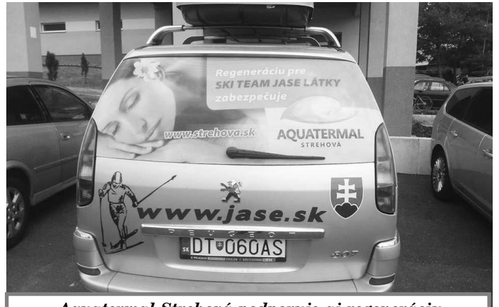
Aquatermal Strehová podporuje aj regeneráciu športovcov v SK TEAM JASE Látky