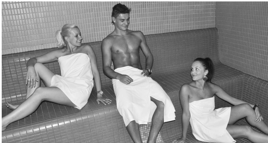
Vďaka prvotriednym službám v každom smere sa hostia do Hotela Aquatermal*** vracajú veľmi radi