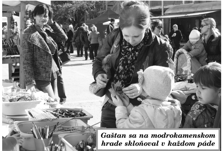
Gaštan sa na modrokamenskom hrade skloňoval v každom páde