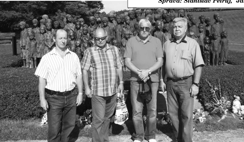
Pamätník obetí obce Lidice zanechá v každom silný dojem

tor. Najnovšiu a najmodernejšiu baňu tu začali budovať koncom 20. storočia. Po útlme baníctva po roku 1991 a pre nevyhovujúce prírodné podmienky - voda, plyn - už vyvírané šachty zakonzervovali. Po výbuchu metánu 29. 11. 2001 na bani Schöller, pri ktorom zahynuli 4 baníci, sa rozhodlo kladňanské bane zavrieť. Posledný "hunt" uhlia zo šachty Tuchlovice vyšiel 31. 3. a zo Schöllera 30. 4. 2002. Tým bola ťažba uhlia v kladňanskej uhoľnej panve ukončená. Aj keď sa tu už viac ako 10 rokov uhlie neťaží, banícke tradície majú zapustené hlboké korene, čo bolo vidieť aj počas osláv dňa baníkov v Čechách na Kladenskom fedrovani. Škoda, že tomu tak nie je aj u nás.