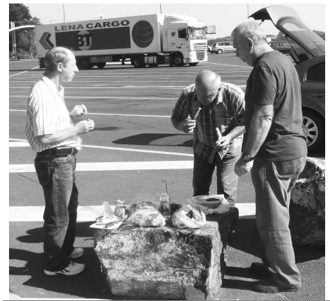
Baníci sú tvrdí chlapi - v pohode zvládnu aj takéto stravovacie provizórium na parkovisku pri diaľnici cestou do Kladna

To bolo v kostole Nanebovzatia panny Márie a potom sa prešlo do záhrady Kladenského zámku, kde predstavitelia českého baníctva odovzdali ocenenia zaslúžilým pracovníkom v baníctve a hutníctve. Okrem baníkov a hutníkov z Čiech tu boli aj baníci z Poľska, Nemecka, Rakúska a samozrejme i Slovenska. Po