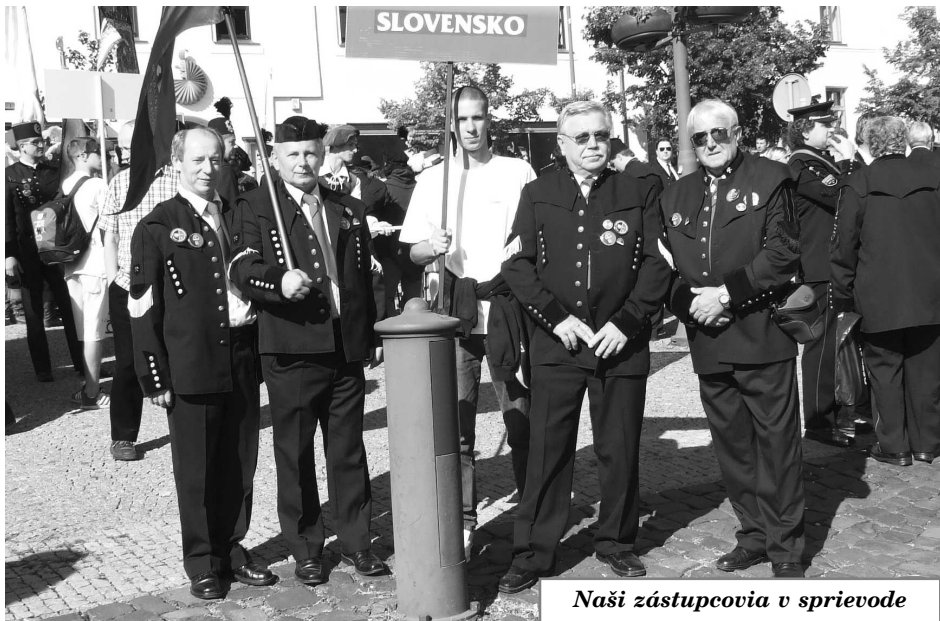
Naši zástupcovia v sprievode