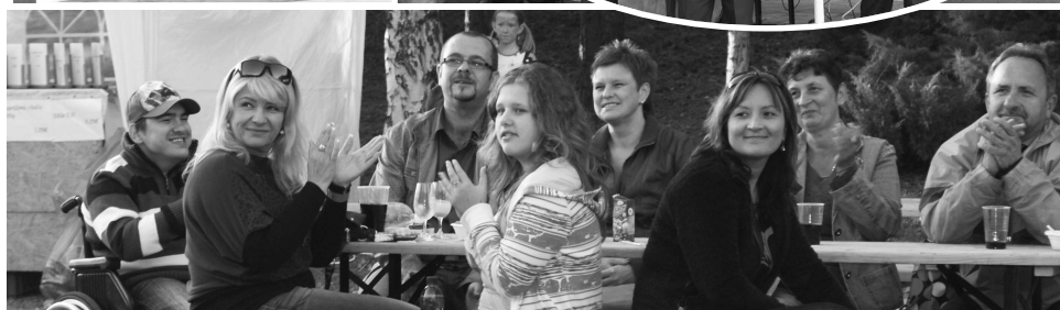
Kvalitné víno z Movina, živá ľudová hudba, rôzne atraktívne súťaže - to bola záruka pohody a dobrej zábavy na podujatí Dni vína Movino