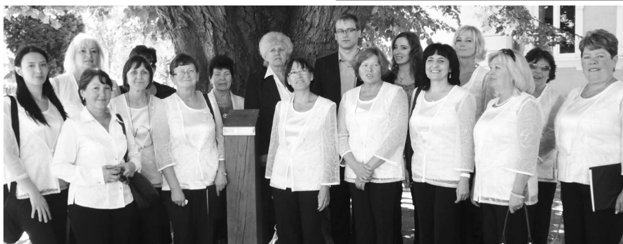
Evanjelický spevokol Nádej - kolektívny člen MO Matice Slovenskej vo Veľkom Krtíši, zaspieval niekoľko duchovných piesní