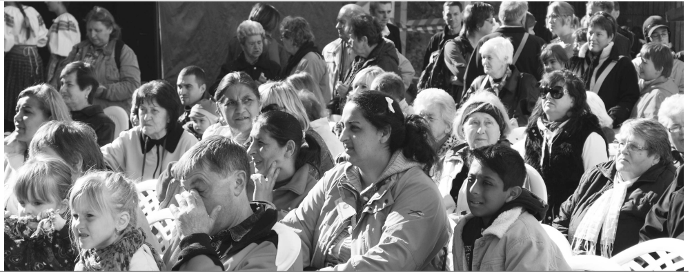
Kultúrny program opäť nesklamal, na pódium sa vystriedali žánre od „rocku až po prší, prší“ a diváci si prišli na svoje