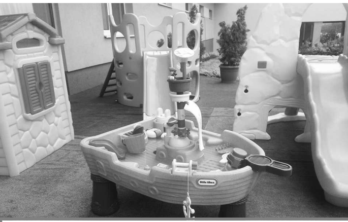
K novinkám uplynulej sezóny patril aj takýto detský kútik - AQUAKIDS plný atrakcií

Otváracie hodiny wellness centra sú denne od 10.00 do 22.00 hod. Otváracie hodiny reštaurácie sú denne od 11.30 do 22.00 hod. (objednávky prijímame do 21.30 hod.).