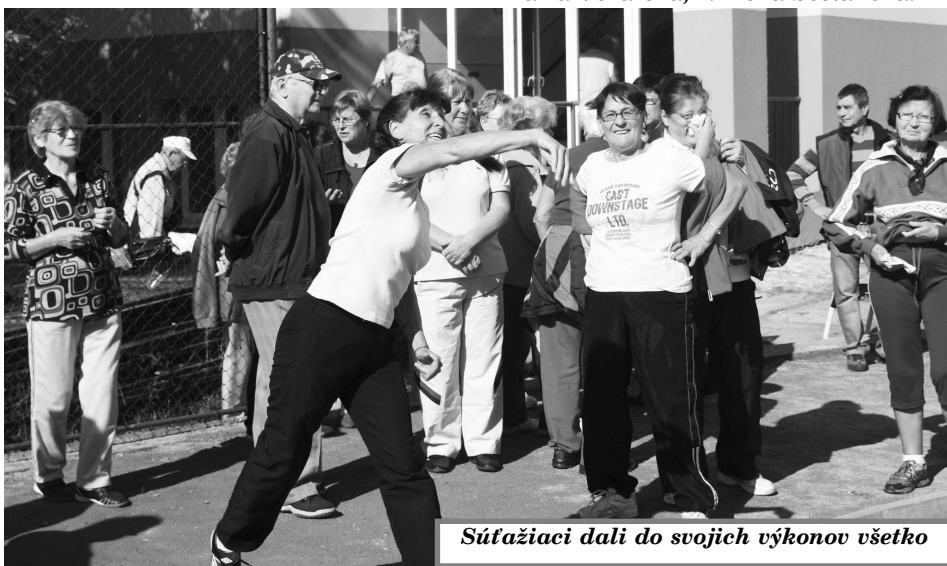
Súťažiaci dali do svojich výkonov všetko